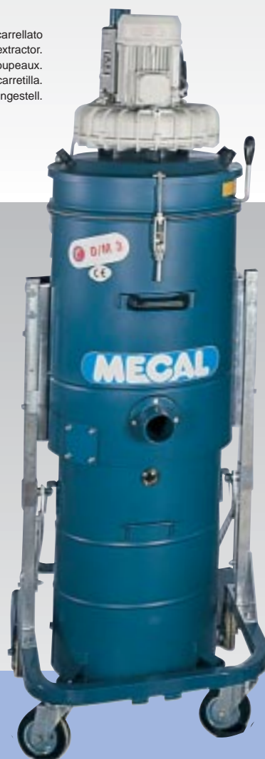
Aspiratore carrellato Trolley swarf extractor. Aspirateur des coupeaux. Aspirador de virutas y carretilla. Absauggerät auf Rollengestell.