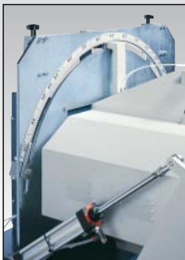
Posizionamento a gradi intermedi Adjusting for intermediate angles Positionnement à degrés intermédiaires Posicionamiento de grados intermedios Zwischengradeinstellung