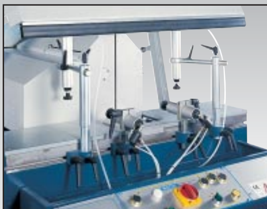
Morse verticali pneumatiche Vertical pneumatic clamps Étaux verticaux pneumatiques Mordazas vertical neumáticas Pneumatische senkrechte Spanner